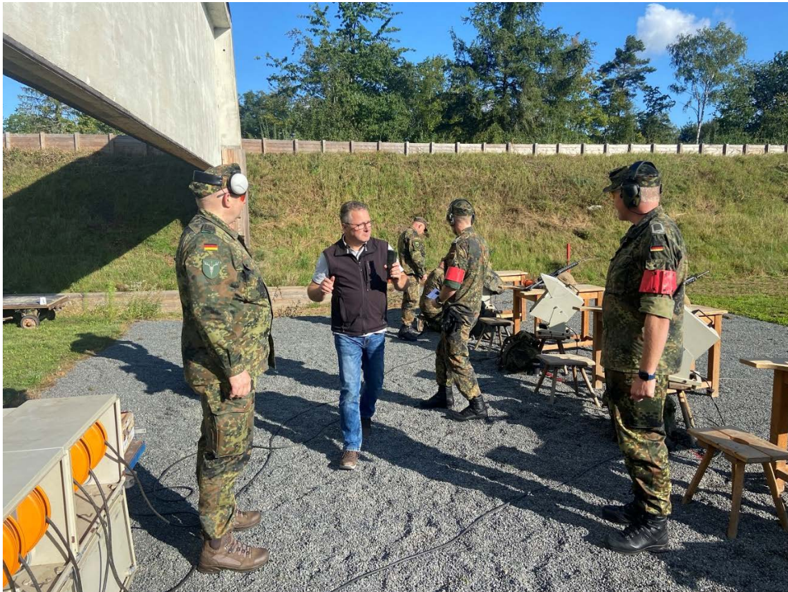
Schießen mit dem G36 auf dem Alpha-Stand