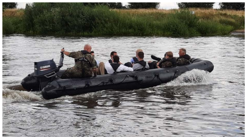
Bilder / Text: M. Blase